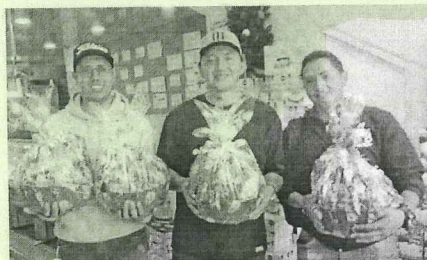
Navidad – Entrega anchetas