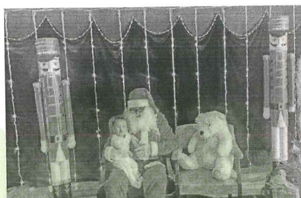
Navidad – Regalos niños