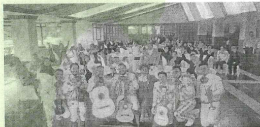
Celebración día Madres